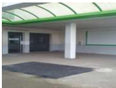
Devant le collège Jean Monnet