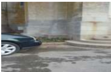
Sur les côtés à l'entrée de l'église

Plusieurs lieux d'installation ont été envisagés :