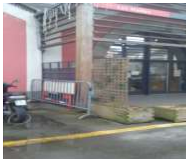
Sur le côté à l'entrée de la bibliothèque municipale