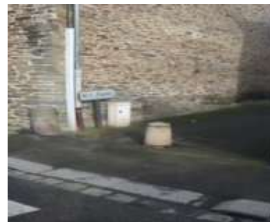
Coin de passage dans la rue Chanoine Rossignol